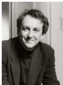
Peter Phillips The Tallis Scholars Direttore

Aspetto pertanto di vedervi in questa bella città per condividere l'amore per la musica corale.